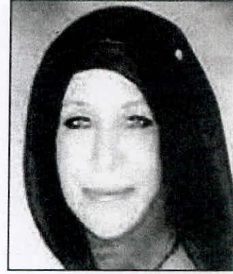
• رباح النجادة

نجحت عمادة القبول والتسجيل في الهيئة العامة للتعليم التطبيقي والتدريب في عملية تسجيل الطلبة المستجدين ولم تظهر على السطح الا مشاكل محدودة مقارنة بالأعوام الماضية التي شهدت فوضى عارمة بين الطلبة ورفضهم لسياسة التوزيع على الكليات والمعاهد فضلاً عن المشاكل التي اعترضت طريق الكثير من الطلبة المستجدين الذين حرموا من دراسة التخصصات التي يرغبون فيها. وقالت مصادر لـ«الشاهد» إن العمادة